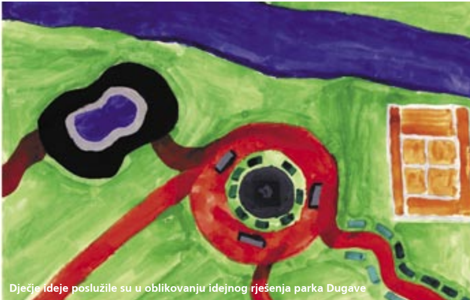
Dječje ideje poslužile su u oblikovanju idejnog rješenja parka Dugave