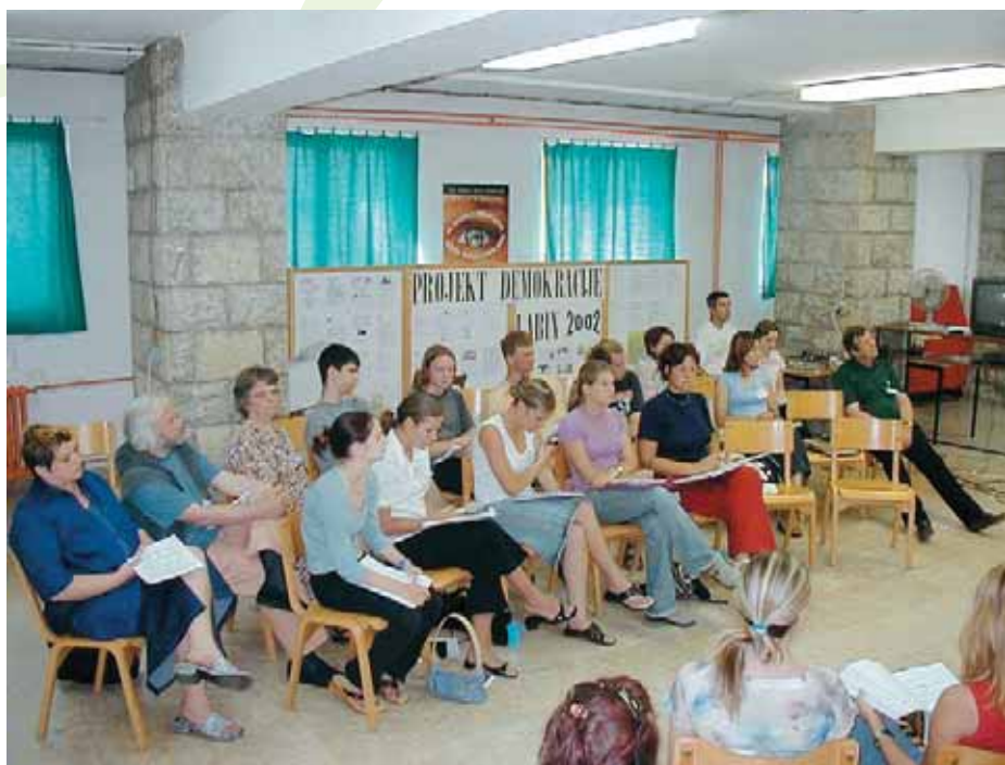
Tečaj Škole demokracije – Vijeća mladih u Labinu 2002. godine

nastave i cijela je škola u funkciji Mini-parlamenta (s obzirom na to da je i znatan dio učenika i nastavnika neposredno ili posredno uključen u tu aktivnost). Za nastavnike i učenike koji nisu angažirani u projektu unaprijed se planira neka stručna ekskurzija ili