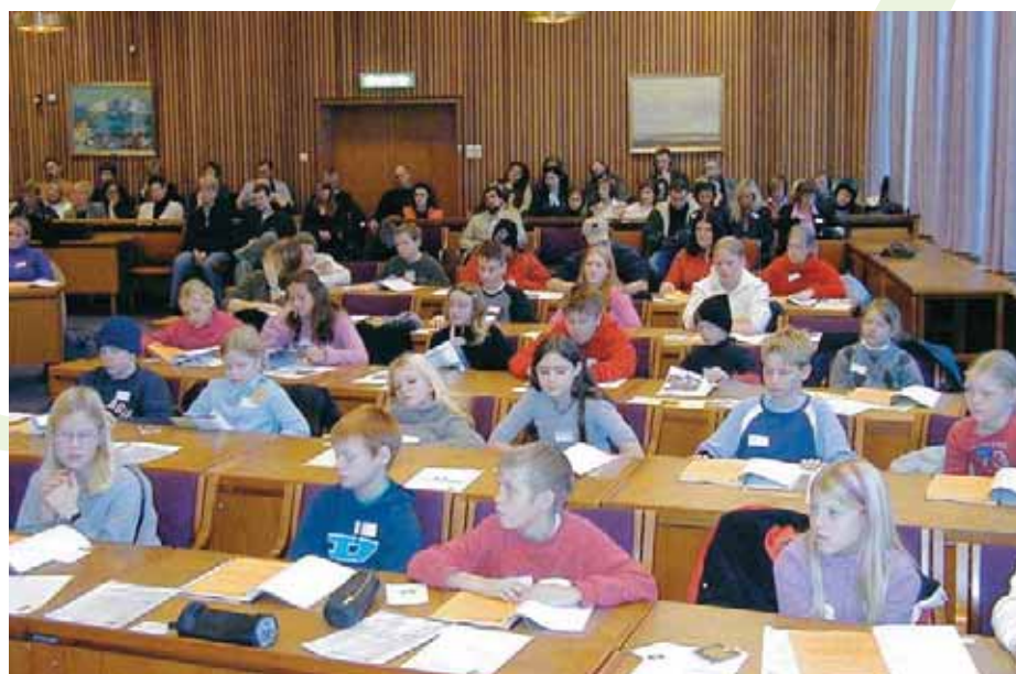
Vijeće mladih grada Sandnesa, Norveška

ćio da se, na funkcionalniji način, motiviraju i uključe učenici u stjecanje znanja i vještina o politici i političkom angažmanu. Jer ovaj program potiče: cjeloživotno učenje,